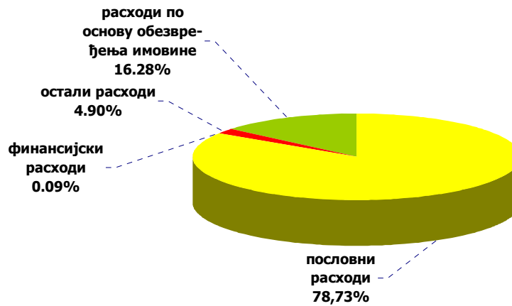
расходи исказани у 2010. години

У наредној табели дат је упоредни преглед расхода исказаних у 2009. и 2010. години и планираних за 2010. годину.